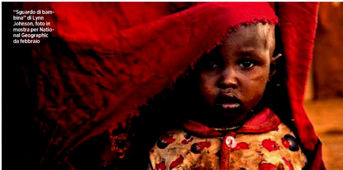
“Sguardo di bambina” di Lynn Johnson, foto in mostra per National Geographic da febbraio